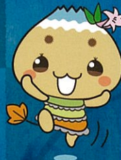
恵那市公式キャラクター エーナ

田の神様ともしび祭り実行委員会 ☎ 080-1553-0315 ✉ info@sakaori-tanada.com