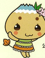
恵那市 公式キャラクター エーナ

不動滝やさいの会・飯地特産品部会・かさぎゆず組合・恵那市朴葉寿司プロジェクト 他